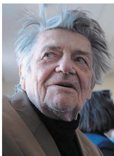
J.-P. Mocky.